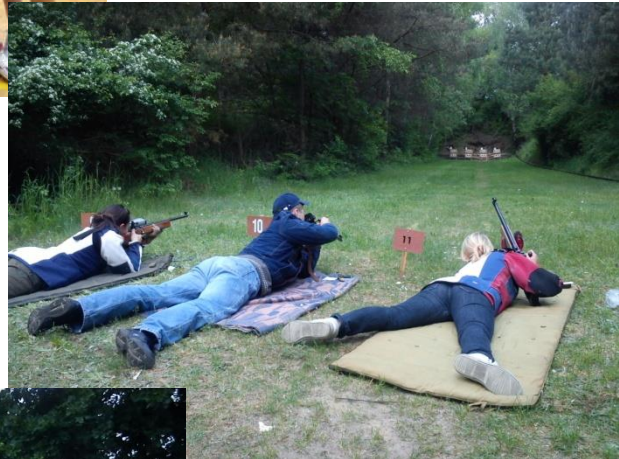
Zawody Srebrne Muszkiety, 05.2011.