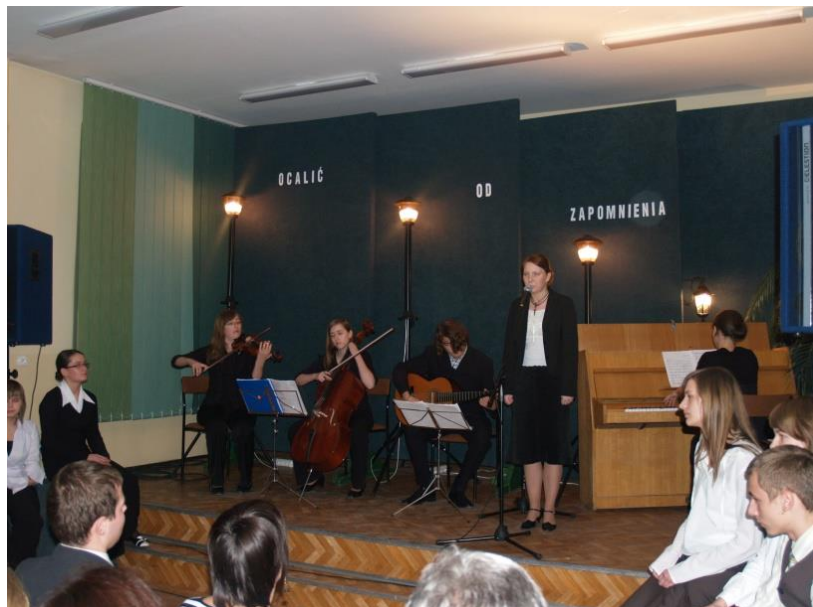
Koncert - Ocalić od zapomnienia M. Grechuta, 11.2006.