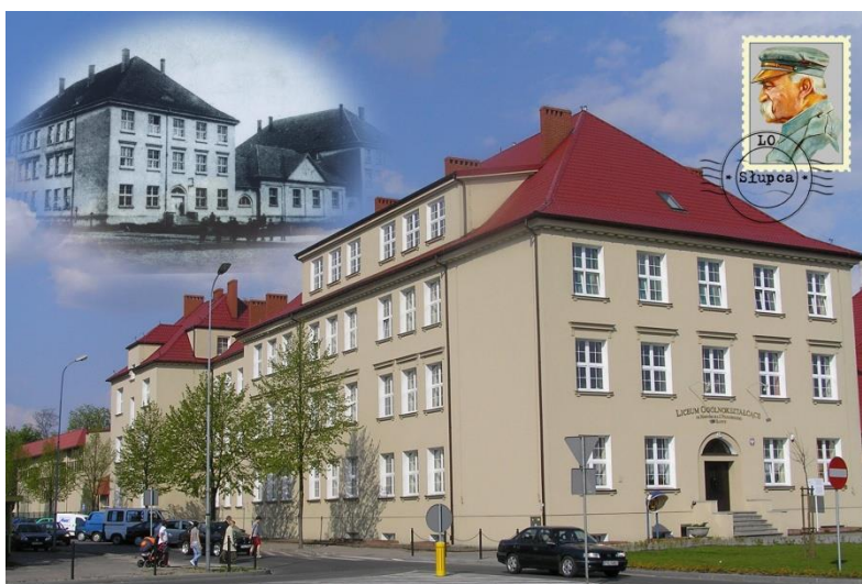
Budynek LO po remoncie, 2008 r.

W roku 2006 wyremontowano sekretariat liceum (drzwi, podłogę i ściany) oraz zakupiono nowe meble. Oddano do użytku także nowoczesnie wyposażoną salę audiowizualną w piwnicy szkoły (w pomieszczeniu byłej stołówki). W tym samym roku wymieniono także drzwi zewnętrzne, 17 okien oraz 9 drzwi wewnętrznych z szybami weneckimi.