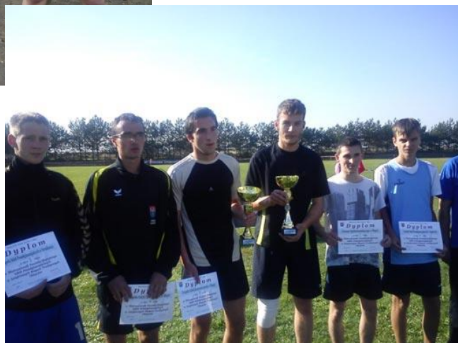
Zawody - inauguracja roku sportowego, 10.2012.

czotówki, zajmując najwyższe w historii szkoły i powiatu medalowe trzecie miejsce na ponad dwieście sklasyfikowanych szkół ponadgimnazjalnych województwa wielkopolskiego. Nasi uczniowie zajmują wysokie miejsca w startach indy-