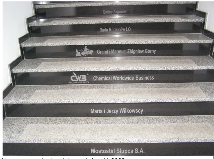
Nasze nowe schody od darczyńców, 11.2008.

W roku 2008 wymieniono 2 spoczniki i 51 stopni schodów wewnętrznych sfinansowanych przez darczyńców, a w całym ciągu schodów budynku głównego założono poręcze ze stali nierdzewnej. Zamontowano także rolety okienne w salach lekcyjnych oraz nowe aluminiowe gabloty na korytarzach; ukończono również saunę, która mieści się na III piętrze budynku. W tym czasie Szkoła Podstawowa Nr 1 oddała do wspólnego użytku boisko wielofunkcyjne. W latach 2008-2010 kompleksowo wyremontowano