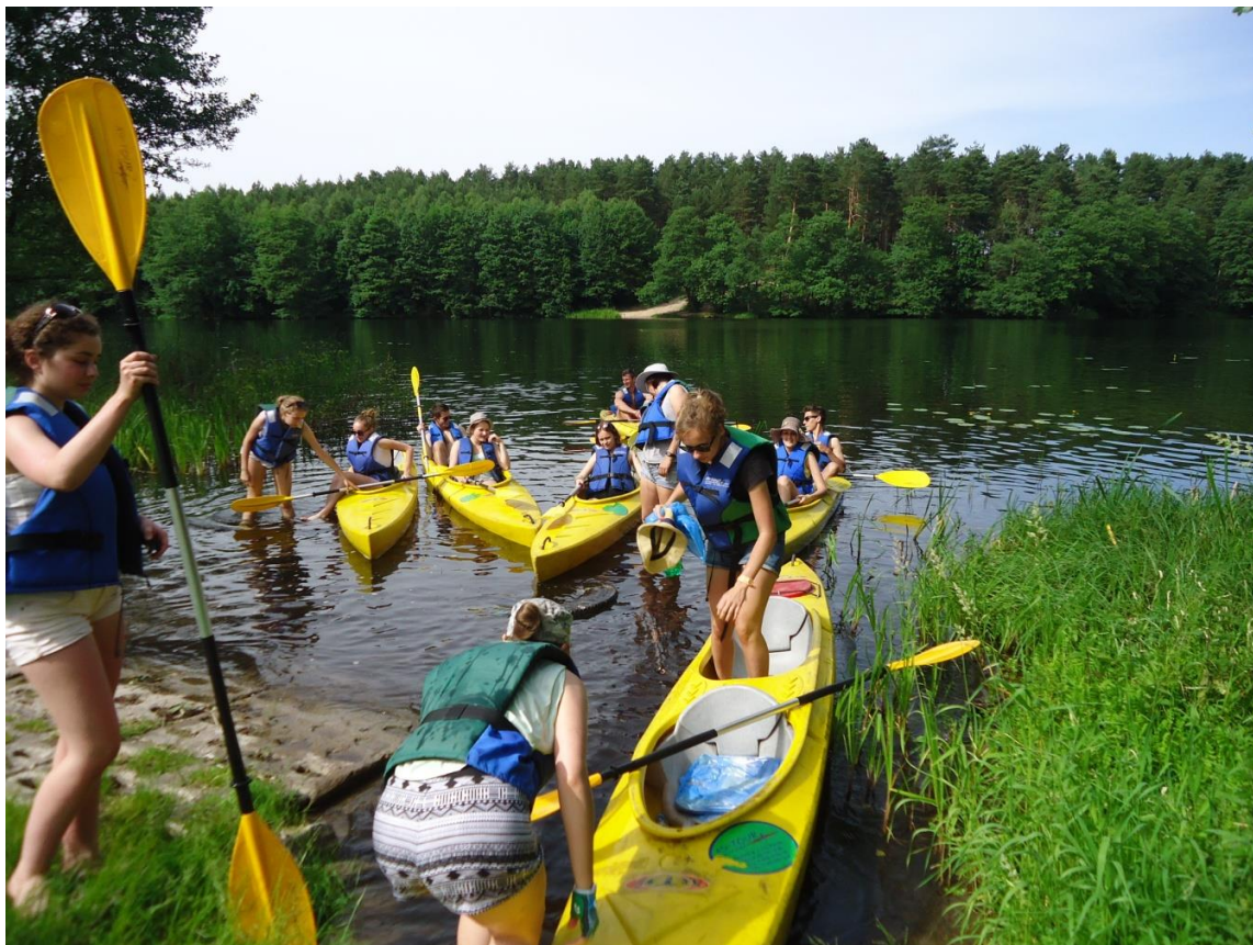
Spływ kajakowy Brdą, 06.2014.

Wycieczki szkolne stanowią ważną formę pracy dydaktyczno-wychowawczej szkoły. Dzięki nim uczniowie mogą wykorzystywać wiedzę teoretyczną zdobytą na lekcjach, rozwijać wrażliwość emocjonalną oraz poznawać formy aktywnego wypoczynku. Należą one do najbardziej lubianych przez młodzież form zajęć szkolnych. W ciągu ostatnich dziesięciu lat lice-