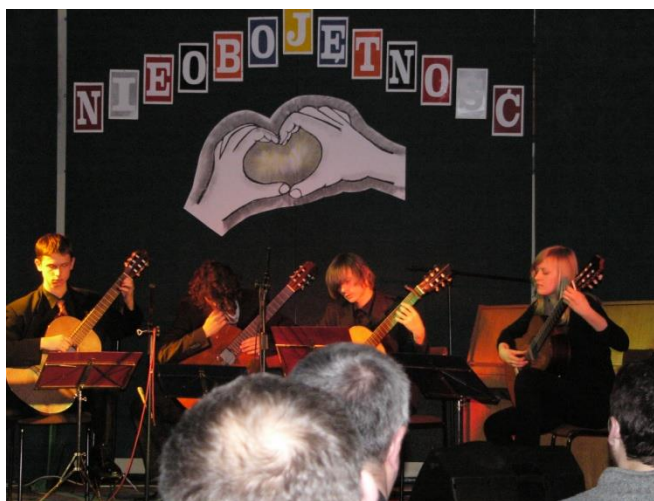
Koncert charytatywny Nieobojętność, 03.2008.

niowie klas trzecich, Samorząd Uczniowski i cała społeczność szkolna zaangażowała się w przygotowanie imprezy, aby pozyskać środki finansowe na zakup protezy, dalszą rehabilitację i leczenie swojej koleżanki. W organizację włączyli się także rodzice, nauczyciele i dyrekcja szkoły. Uczniowie przygotowali również loterię fantową, a w koncercie wystąpiła nie tylko młodzież z LO, ale także innych słupeckich szkół.