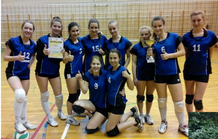
Mistrzostwa rejonu Konin w piłce siatkowej dziewcząt, 03.2014