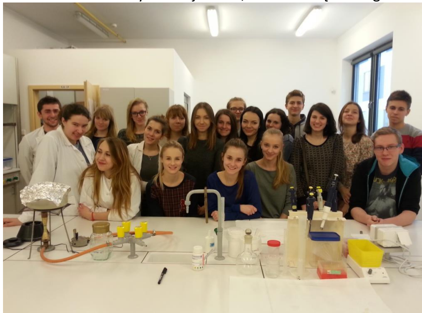
Projekt naukowy z UP w Poznaniu - Od laika do przyrodnika, 01.2015.

w ramach projektu „Uniwersytet w Twojej szkole”. Dzięki niemu uczniowie mieli okazję wysłuchać i obejrzeć on-line wiele wykładów prowadzonych przez pracowników uniwersyteckich i skorzystać z możliwości zadawania naukowcom pytań w czasie wykładu. Licealiści brali również udział w rywalizacji szkół, uczestnicząc w ligach: historycznej, matematycznej