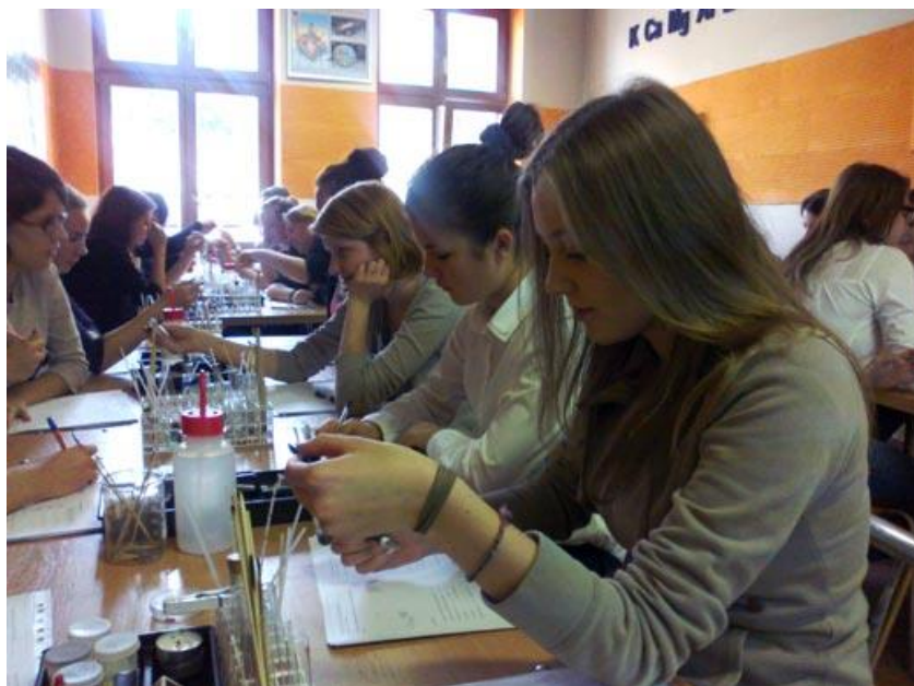
Zajęcia w Centrum Chemii w Toruniu, 11.2012.