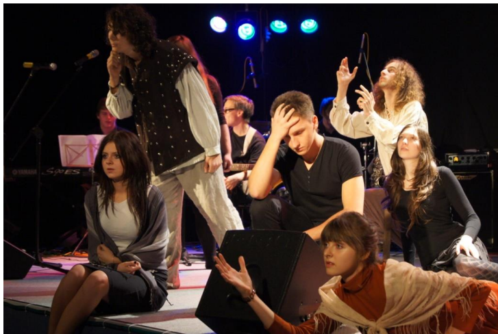
Projekt teatralny -sztuka -Proces w Szamgorod, 11.2011.

Jej tematem były sceny z życia Szwecji i Finlandii w latach 60. Projekt w roku szkolnym 2008/2009 zaowocował przedstawieniem „Ich bin nicht so...” (Nie jestem taki). Spektakl pokazywał życie rodzinne, problemy i obawy przed tym, co przyniesie przyszłość, a także radosne oczekiwanie na dorosłość oraz dylematy związane z wyborem zawodu i zmieniającą się rolę Polski w Europie. Kolejna odsłona naszego projektu (2009/10) to : „W Zatrzęsieniu” ( „ Im Gewimmel” ) w całości poświęcona poezji polskiej noblistki Wisławy Szymborskiej. Natomiast w roku szkolnym 2011/12 młodzież zaprezentowała collage sceniczny na podstawie sztuki Elie Wiesela : „Der Prozess von Shamgorod” („Proces w Szamgorod”) .Sztuka Wiesela to swoisty proces wytoczony Bogu, który pozostaje obojętny wobec krzywdy narodu żydowskiego. Spektakl został wystawiony w Oświęcimiu oraz w Bergen – Belsen. Tytuł spek-