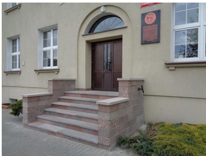
Nowe kamienne schody wejściowe, 04.2016.

W 2016 roku liceum wzbogaciło się o piękne schody wejściowe do budynku głównego. Jest to dar dla szkoły od Zarządu i Rady Powiatu Słupckiego na jubileusz 90-lecia szkoły. Po przeprowadzonych sukcesywnie remontach budynek liceum zyskał nową lepszą jakość zarówno estetyczną jak i użytkową, co w znacznym stopniu przyczyniło się to do podniesienia komfortu uczenia się i nauczania, a tym samym zwiększenia skuteczności poziomu kształcenia.