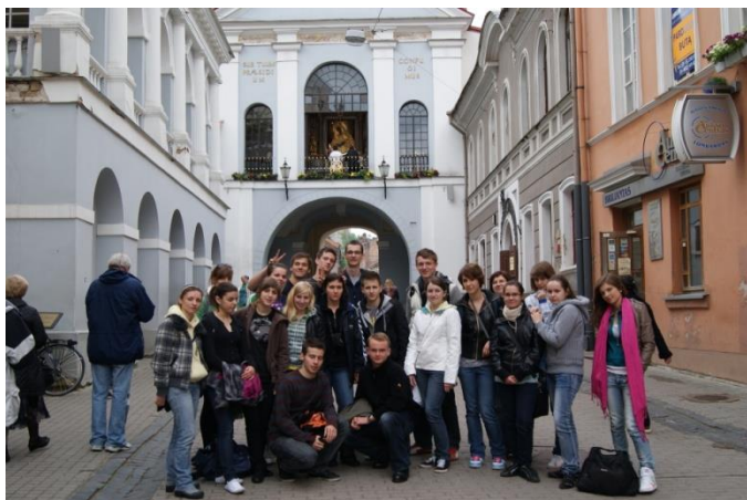
Licealiści zwiedzają Wilno - w drodze do Finlandii, 05.2010.

Oświęcimia, Torunia, Wrocławia, Lublina, Częstochowy oraz Biskupina były okazją do pogłębiania wiedzy na temat ojczystej kultury i historii, ponieważ ważny punkt każdej z nich stanowiło zwiedzanie zabytków i miejsc pamięci. Natomiast podczas wyjazdów do Zakopanego, w Kotliną Jeleniogórską, w Bieszczady czy Kotlinę Kłodzką, szczególnie w czasie pieszych wędrówek szlakami górskimi, młodzież poznawała piękno przyrody ojczystej oraz uświadamiała sobie, jak ważna jest ochrona środowiska naturalnego.