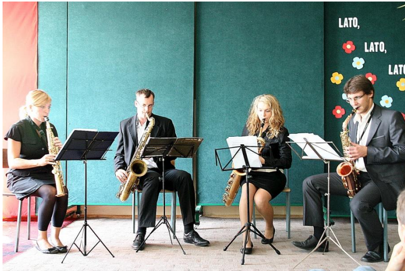
Comiesięczny koncert filharmonii, 09.2009.

9 listopada 2009r. w sali MDK odbył się wyjątkowy koncert Filharmonii Poznańskiej im. Tadeusza Szeligowskiego upamiętniający 50 lat holistyczno-kameralnych spotkań muzycznych z młodzieżą naszej szkoły. Artyści po raz pierwszy przyjechali do liceum w 1959r. Od tego czasu w trakcie koncertów przybliżają twórczość wielkich kompozytorów, wyrabiają u słuchaczy poczucie piękna