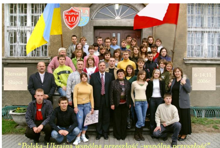
Projekt Polska-Ukraina wspólna przeszłość, wspólna przyszłość, 11.2006.

W opisywanym okresie młodzież LO w Słupcy uczestniczyła w wymianach międzynarodowych oraz wielu projektach (w tym także finansowanych przez UE). Ich realizacja wzbogaca proces dydaktyczno-wychowawczy, umożliwiając wszechstronny rozwój uczniów, nauczycieli i oczywiście bazy dydaktycznej.