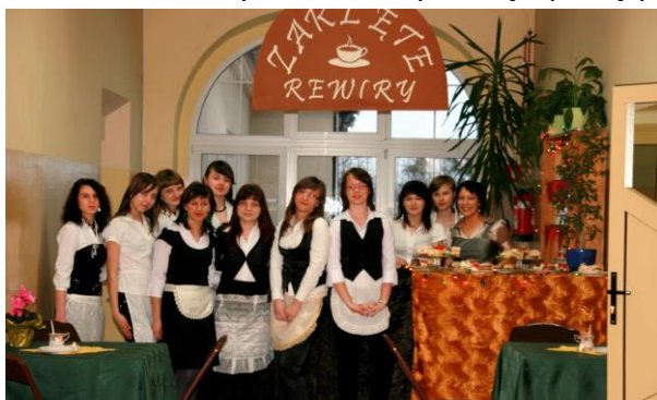
Kawiarenka „Zakłète rewiry”, r. szk. 2009-2010.