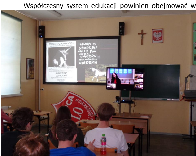
Liga angielska szkół Wielkopolski ( terminal video), 05.2014.

temu oświaty”. Pomysłodawcami i wykonawcami byli pracownicy Instytutu Matematyki i Informatyki Politechniki Wrocławskiej. Projekt wykorzystywał sprawdzony system wspomaganie nauczania, w którym zaawansowane technologie są ściśle powiązane z aktywnym udziałem nauczycieli i uczniów.