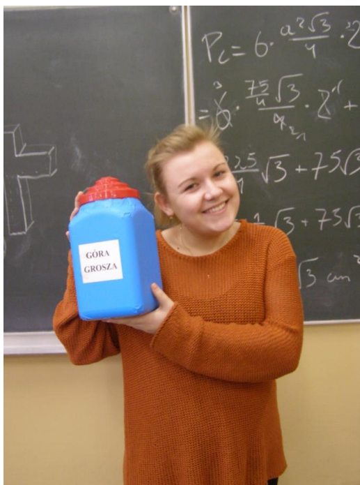
Akcja charytatywna - Góra grosza, 12.2011.

Bezinteresowna pomoc drugiemu człowiekowi to jedno z haseł przewodnich naszej placówki. W słupeckim LO jest wielu uczniów i nauczycieli, którzy chcą pomagać, promować idee humanitaryzmu oraz podejmować się bezinteresownej pracy na rzecz innych ludzi. Szkoła aktywnie włącza się w różne akcje charytatywne. Ważnym wydarzeniem w 2008 roku były koncerty „Nieobojętność” zorganizowane przez młodzież na rzecz zmagającej się z chorobą nowotworową uczennicy. Ucz-