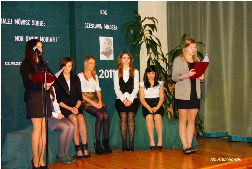
Wieczór poetycki – Rok Czesława Miłosza, 12.2011.