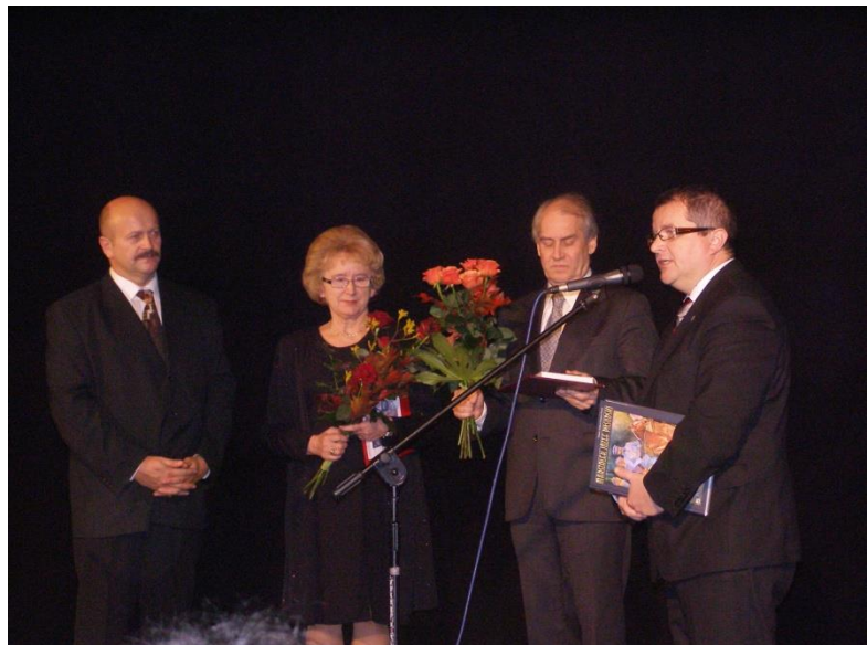
Uroczystość z okazji 50 lat koncertów Filharmonii w LO, 12.2009.