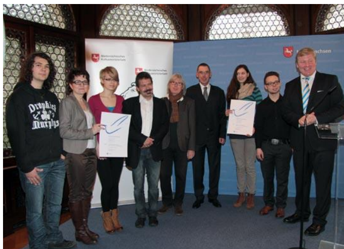
Pokojowa Nagroda dla LO i RGS od Ministerstwa Ed. Dolnej Saksonii, 03.2013.

Nie sposób wymienić wszystkich sukcesów uczniowskich, ale z pewnością warto wymienić przyznaną przez Ministerstwo Kultury Dolnej Saksonii w 2013r. Pokojową Nagrodę dla LO w Słupcy i Ratsgymnasium Stadthagen przyznaną za: „inicjatywę i projekty w obszarze pojednania narodów, niwelowania stereotypów i prewencji przemocy” (za wspólne projekty teatralne).