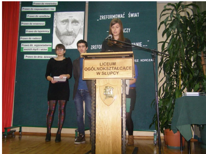
Liceum obchodzi Rok Korczaka, 11.2012.

Szkoła często bierze udział w ważnych akcjach społecznych i patriotycznych organizowanych na terenie całego kraju. Jedną z nich było uczczenie siedemdziesiątej rocznicy śmierci polskiego pedagoga, publicysty, pisarza, a przede wszystkim wyjątkowego człowieka – Janusza Korczaka. Oddając hołd temu wielkiemu bohaterowi Sejm RP ogłosił rok 2012 - Rokiem Janusza Korczaka. W liceum ten czas obchodzono w sposób szczególny -uczniowie mogli obejrzeć film A. Wajdy