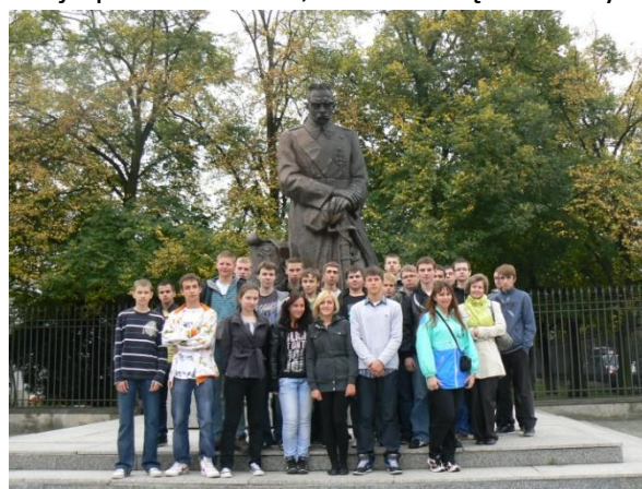
Wycieczka 2A do Warszawy, 06.2011.