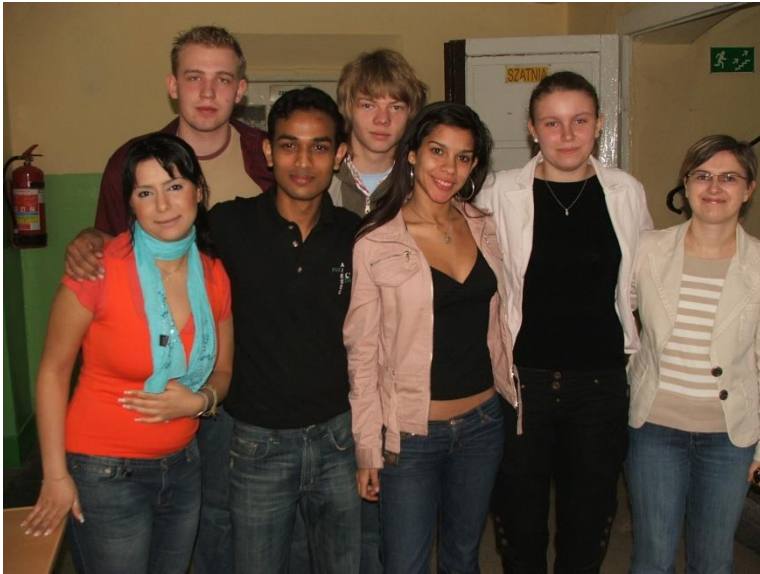
Projekt Peace, 03.2007.

Na przestrzeni 10 lat niemal każdego roku szkoła realizowała we współpracy z AISEC