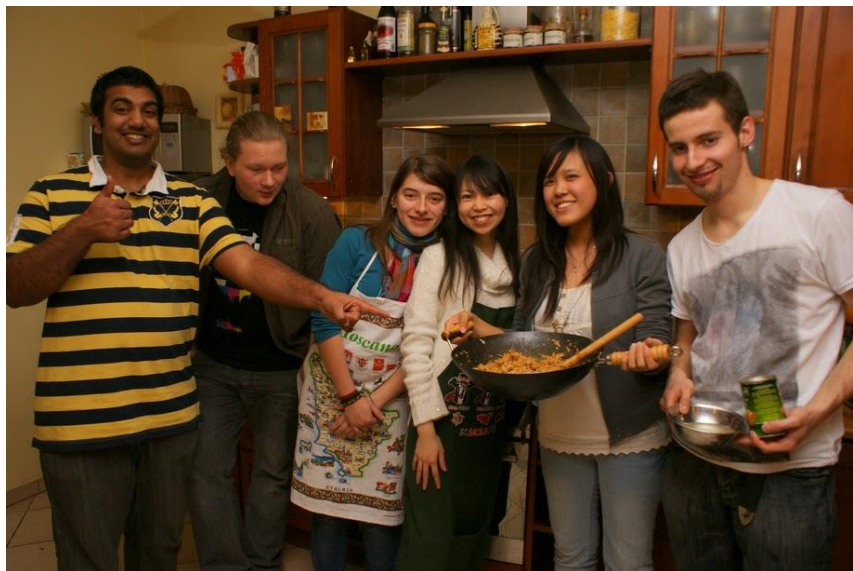
Projekt Peace -Lekcja Tolerancji, 03.2010.

roku 2006 odbyło się osiem edycji projektów. Tradycyjnie zasadniczą część wymiany związana jest z problematyką zagłady, nazizmu, agresji i przemocy. Tematyka ta (także rozszerzana o inne problemy np. terroryzm) realizowana była w Krakowie, Warszawie, Berlinie, Hanowerze, Słupcy i Stadthagen. Wymiana każdego roku składa się z dwóch etapów. Część pierwszą