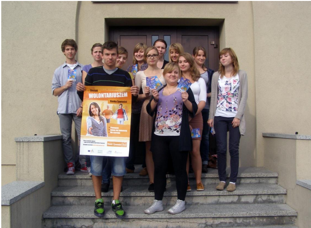
Wolontariusze szkolni, 10.2011.