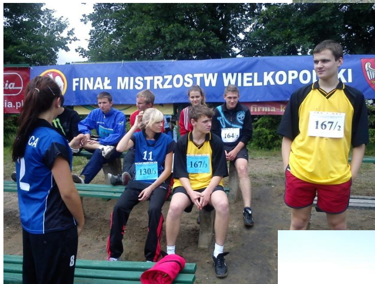
Finał wojewódzki w biegach przełajowych, 06.2012.

widualnych podczas zawodów szkolnych i pozaszkolnych. Jesteśmy rozpoznawalni na parkietach Wielkopolski w siatkówce, koszykówce oraz piłce ręcznej. W latach 2006-15 wywalczyliśmy sobie wysokie miejsca w Wielkopolsce w rywalizacji sportowej szkół SZS , między innymi: