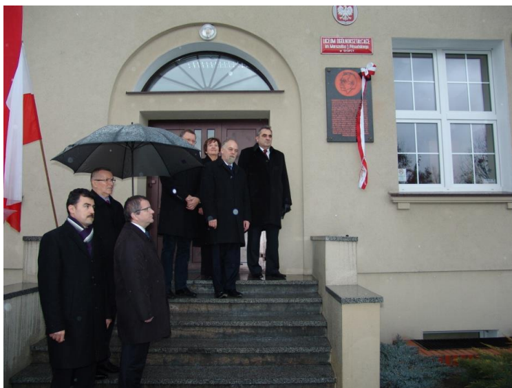
Dzień Patrona odsłonięcie tablicy M. J. Piłsudskiego 12.2011