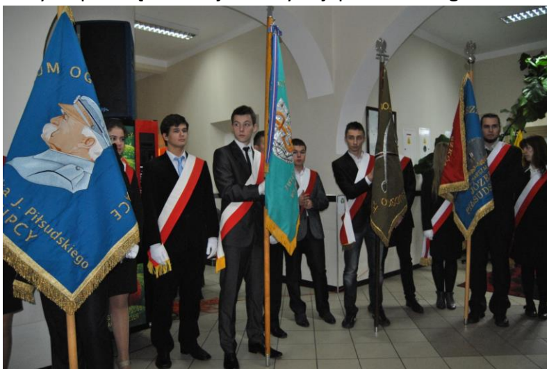
XII Zlot Szkół im. Marszałka J. Piłsudskiego - poczty sztandarowe, 12.2013