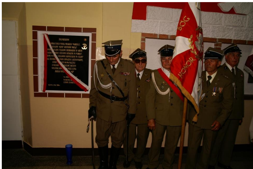
Odsłonięcie tablicy poświęconej uczniom LO z Konspiracyjnego Wojska Polskiego, 06.2006.

uroczystości z okazji Roku Zbigniewa Herberta, uroczystość z okazji Roku Korczakowskiego, odsłonięcie pamiątkowej tablicy poświęconej uczniom LO – żołnierzom K.W.P, odsłonięcie pamiątkowej tablicy poświęconej uczniom liceum z Polskiej Partii Wolności represjonowanym przez Urząd Bezpieczeństwa w 1950 roku, apel poświęcony zmarłym w Katastrofie Smoleńskiej oraz wiele innych.