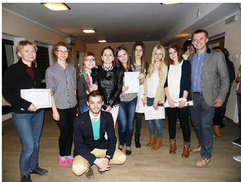
Euroweek - szkoła liderów, 03.2014.

jest realizowane pod patronatem Wielkopolskiego Kuratora Oświaty oraz Rektora Uniwersytetu Przyrodniczego w Poznaniu.