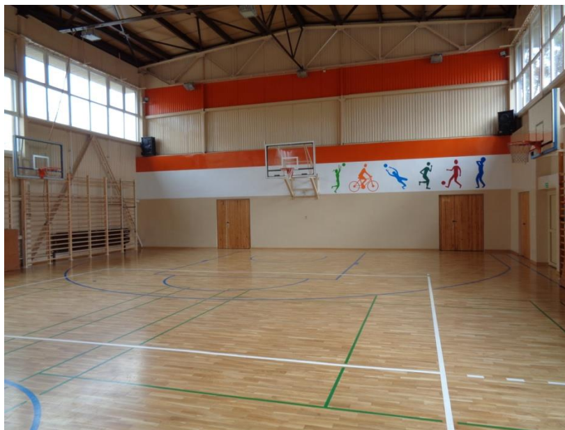
Parkiet dębowy, nowe okna i drabinki na sali gimnastycznej, 09.2015.

Na parkingu szkolnym oraz przed biblioteką położono także kostkę brukową. Oddano również do użytku salkę fitness.