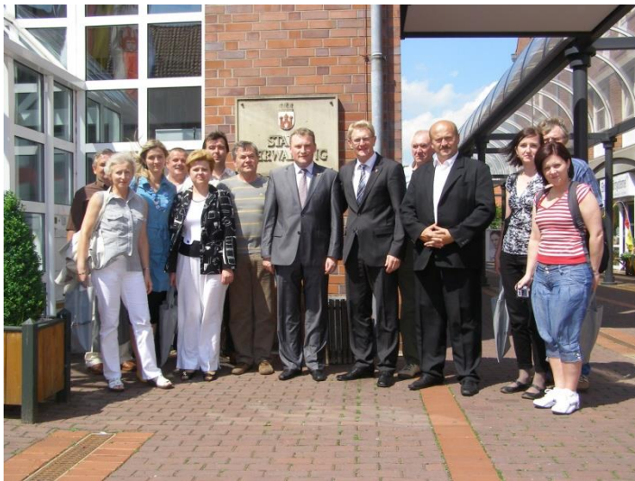
Jubileusz 20-lecia wymiany-Stadthagen, 06.2010.