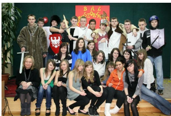
Bal pierwoszoklasy, 02.2010.