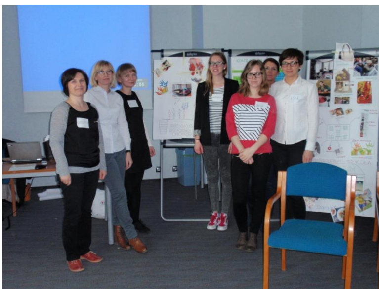
Projekt Szkoła Współpracy, 03.2015.

Jego celem było wzmocnienie współpracy pomiędzy uczniami, rodzicami i nauczycielami, a także przedstawicielami środowisk społeczności lokalnych działających w przedszkolach i szkołach w Polsce. Założenie to realizowano przez opracowanie, upowszechnienie i wdrożenie modelowych rozwiązań. Ideą projektu było inspirowanie środowiska szkolnego i przedszkolnego do wdrażania dobrych praktyk w zakresie współpracy w placówkach, a także wprowadzenie trwałych zmian w postrzeganiu roli uczniów i rodziców w pracy szkoły.