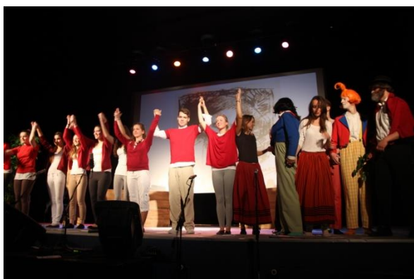
DEN - Powiat i LO -sztuka Max und Moritz, 10.2015.

20 października 2015r. w Miejskim Domu Kultury w Słupcy odbyły się organizowane