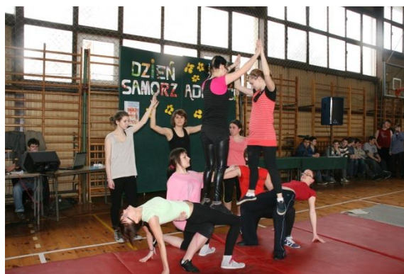
Dzień samorządności, 03.2010.

loterie fantowe. W 2010 roku uczniowie z SU uruchomili w liceum kawiarenkę „Zakłète rewiry”, która jest chętnie odwiedzana przez uczniów i nauczycieli. Pod życzliwą opieką p.