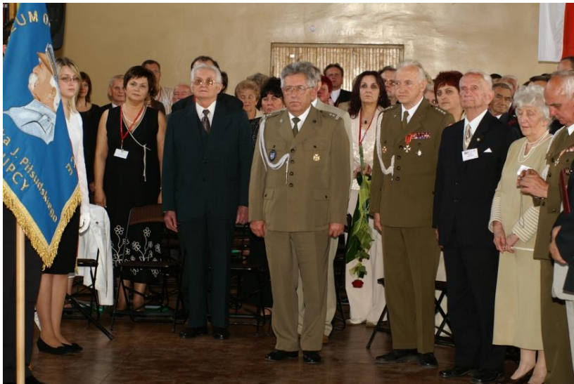
80-lecie LO, 10.06.2006.

10 czerwca 2006r. obchodziliśmy jubileusz 80-lecia Liceum Ogólnokształcącego