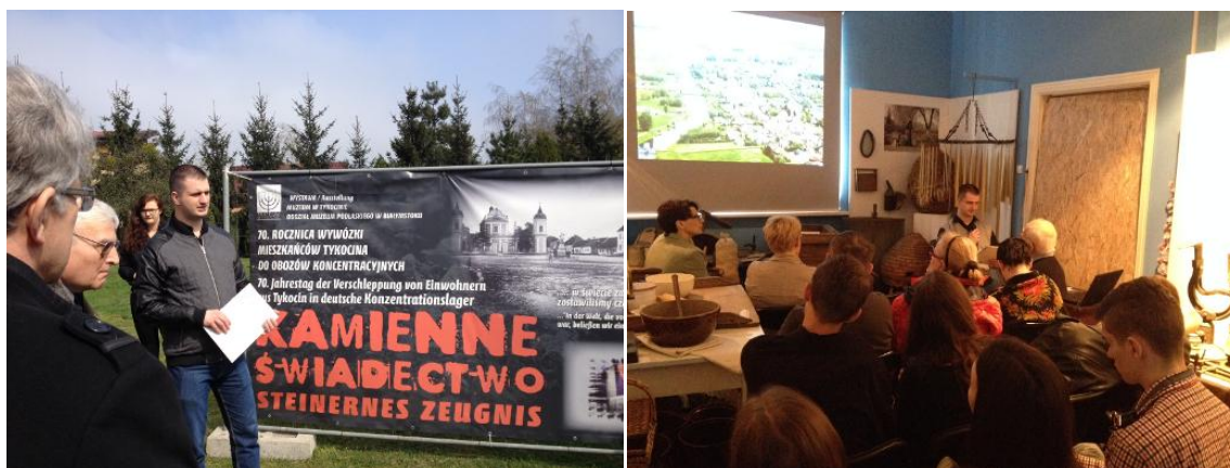
Młodzież z LO podczas wystawy "Kamienne świadectwo" w Muzeum Regionalnym w Słupcy