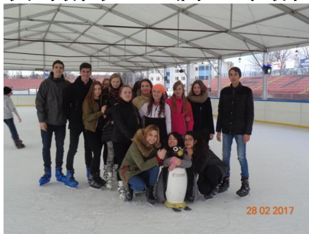
Uczestnicy projektu World Talks podczas integracji na lodowisku