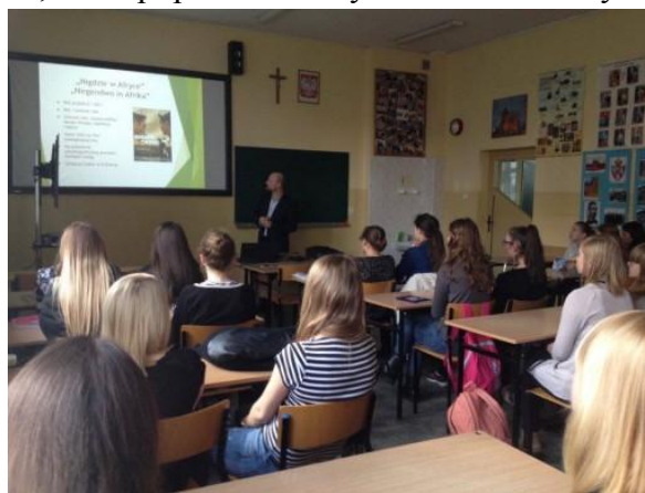
Uczniowie klas 1. i 2. podczas warsztatów filmowych