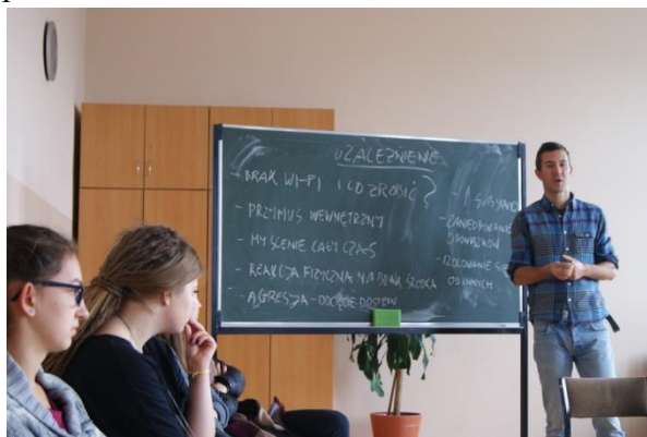
Uczennice klasy 2d podczas warsztatów

Celem projektu było zwiększenie świadomości na temat negatywnych skutków działania środków psychoaktywnych, poznanie sposobów zapobiegania zagrożeniom wynikającym z używania środków psychoaktywnych oraz procedur postępowania wobec dzieci i młodzieży w sytuacjach wynikających z ich zażywania. W naszym liceum odbiorcami projektu byli uczniowie, nauczyciele i rodzice. Rodzice i opiekunowie poznali wskazówki jak wspierać abstynencję dziecka oraz jak rozpoznać negatywne skutki działania środków psychoaktywnych. Ponadto zapoznali się z zagrożeniami wynikającymi ze stosowania środków psychoaktywnych przez młodzież.