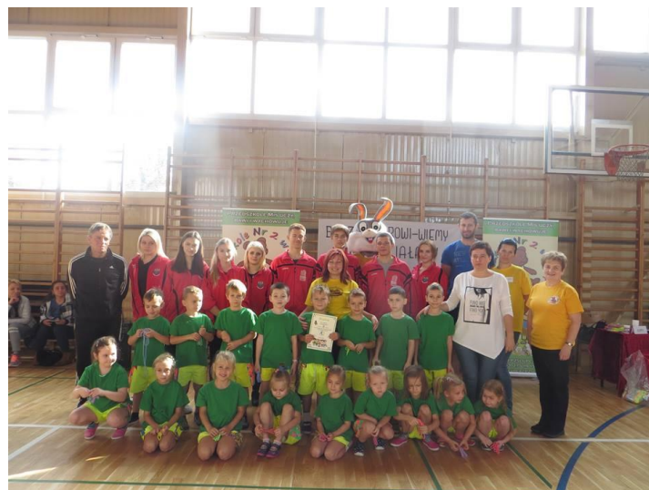
Przedszkolaki z "Misia" wraz z opiekunami i uczniami słupckiego liceum

Na koniec odbyło się liczenie punktów, wręczenie dyplomów i nagród dla wszystkich dzieci. W tegorocznej Spartakiadzie zwyciężyła grupa Wiewiórek. Wszystkim dzieciom gratulujemy dobrej postawy, a My jako Liceum dziękujemy, że mogliśmy być częścią Waszego Świąta. Dziękujemy również naszym uczniom, którzy stanęli na wysokości zadania pomagając najmłodszym w sportowych zmaganiach na parkiecie.