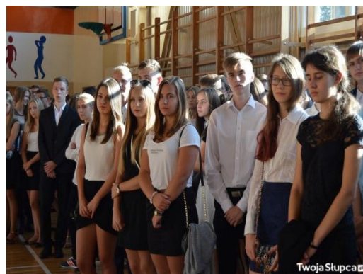
Grono pedagogiczne i uczniowie liceum podczas uroczystości rozpoczęcia roku szkolnego