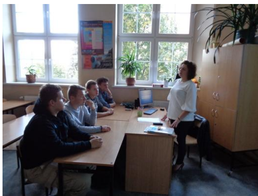
Uczniowie 3c podczas spotkania z doradcą