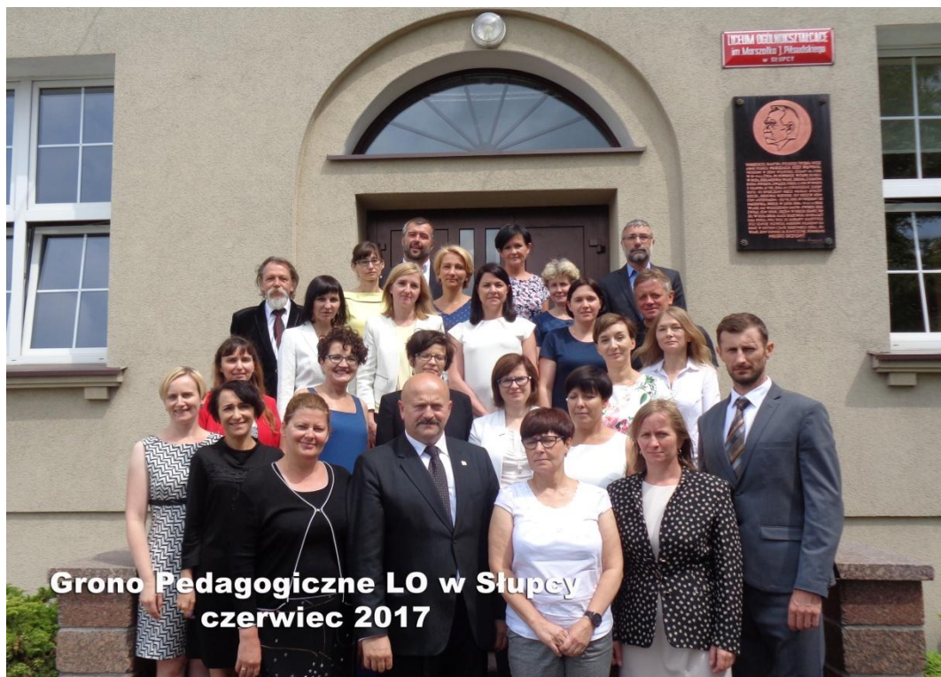
Grono Pedagogiczne LO w Słupcy czerwiec 2017