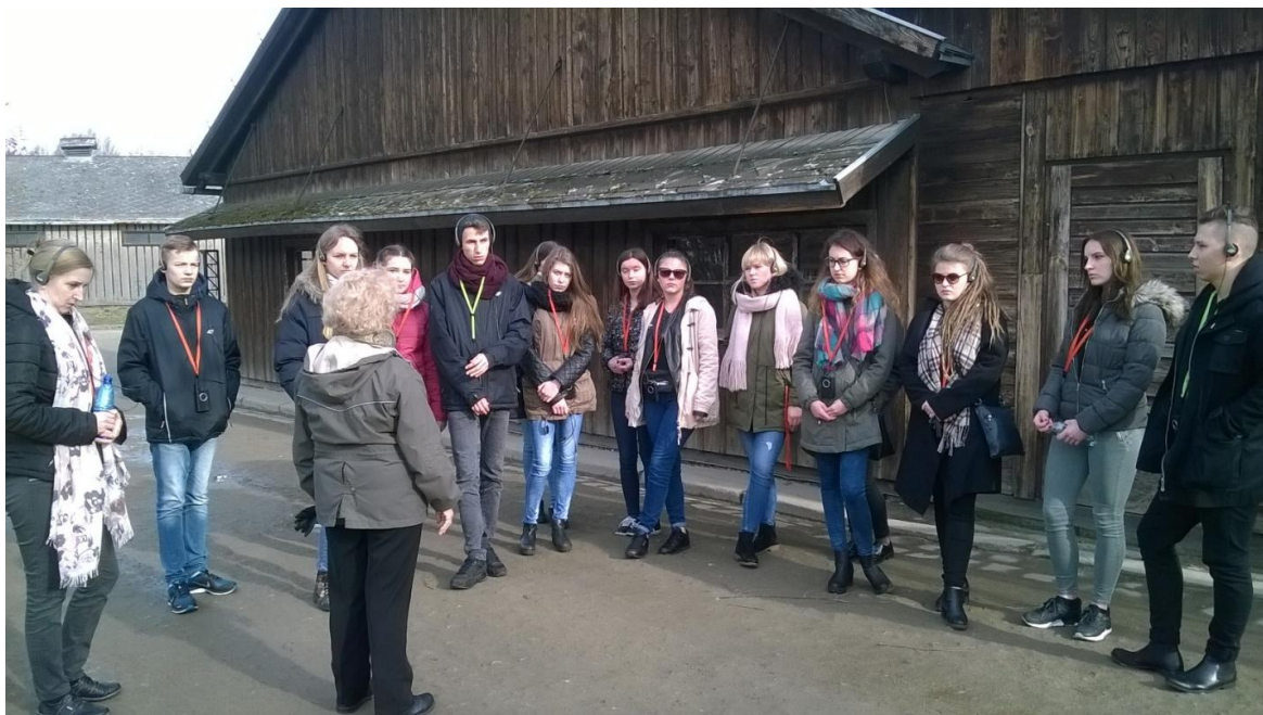
Uczestnicy polsko-niemieckiej wymiany