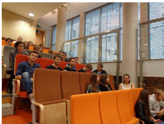
Uczniowie klasy 2a podczas wykładów

28 października klasa 2a uczestniczyła w wycieczce do Poznania, której głównym celem była wizyta na Uniwersytecie Ekonomicznym. Uczniowie wysłuchali wykładu światowej sławy specjalisty – prof. Wojciecha Cellarego na temat: „Przyszły cyber-świat dla dzisiejszych licealistów”, który dotyczył e-biznesu oraz nowych technologii informacyjnych. W bardzo nowoczesnej sali audialnej UE zgromadziło się około 250 licealistów z wielkopolskich szkół, a wykład został wygłoszony w ramach projektu Klasa Akademicka. Uczniowie starali się zapamiętać jak najwięcej cennych wiadomości i rad, które będą mogli wykorzystać, wybierając kierunek dalszego kształcenia, a także szukając pracy. Dodatkową atrakcją dla uczniów klasy 2a była poprzedzająca wykład wizyta w Jump Arena – miejscu, gdzie przez godzinę z zapalem oddawali się przyjemności skakania na trampolinach i nurkowania w basenach z gąbkami. Szło im całkiem nieźle.