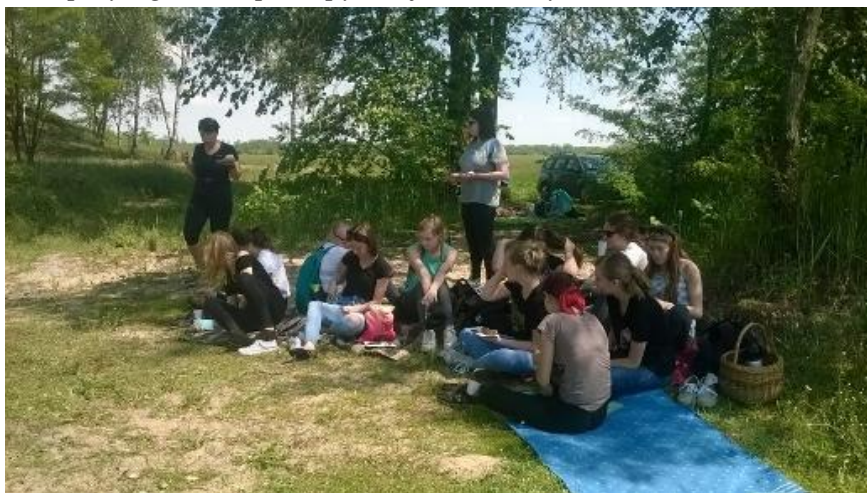
Piknik klasy 1d na terenie Nadwarciańskiego Parku Krajobrazowego

pomniku i poznać dokładną jego historię, a to za sprawą bolesnych ukąszeń komarów, których było mnóstwo na naszej trasie wycieczki. Pod koniec wędrówki czekała na nas niespodzianka: pieczenie kielbasek przy ognisku i picie pysznej lemoniady.