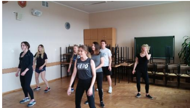
Uczennice LO podczas zajęć z zumbą

prowadzi do zniszczenia relacji z rodziną i przyjaciółmi i niezdolności do pracy zarobkowej. W najgorszym przypadku depresja może być przyczyną samobójstwa i jest drugą najczęściej występującą przyczyną zgonów w grupie osób w wieku 15-29 lat. Ale depresji można zapobiegać i można ją leczyć. Lepsze zrozumienie tego, czym jest ta choroba i w jaki sposób można jej zapobiegać lub ją leczyć, pomoże zmniejszyć stygmatyzację związaną z depresją i może zachęcić więcej osób do szukania pomocy. Ogólnym celem jednorocznej kampanii, która rozpoczęła się 10 października 2016 czyli w Światowym Dniu Zdrowia Psychicznego jest doprowadzenie do tego, aby we wszystkich krajach więcej osób cierpiących na depresję szukało pomocy i ją otrzymało.