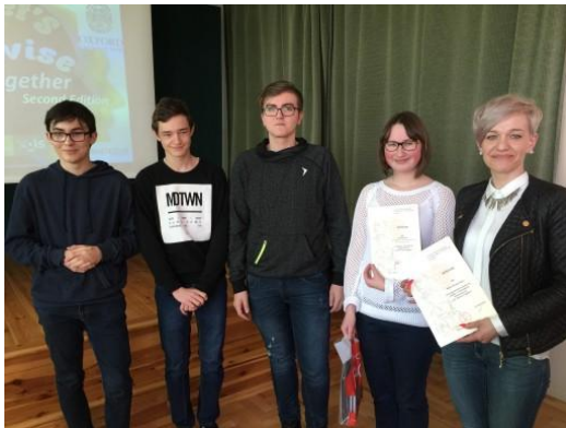
Drużyna z Gimnazjum im. Królowej Jadwigi w Zagórowie

w Zagórowie, Gimnazjum im. Mikołaja Kopernika w Słupcy oraz Publiczne Gimnazjum im. Organizacji Wojskowej w Łądku. Nasi młodzi koledzy zmierzali się w 8 konkurencjach sprawdzających ich znajomość języka angielskiego, na różnych płaszczyznach. Musieli wykazać się nie tylko wiedzą ogólną z zakresu gramatyki czy słownictwa, ale również przejść przez zadania związane ze znajomością kultury i geografii krajów anglojęzycznych, czytaniem czy precyzyjnym rozumieniem ze słuchu. Najlepiej poradziła sobie młodzież z Gimnazjum w Strzałkowie zajmując pierwsze miejsce. Tuż za nimi na miejscu drugim znalazło się Gimnazjum w Słupcy, a na trzeciej pozycji uplasowało się Gimnazjum w Drażnej. Dla wszystkich uczestników przygotowaliśmy nagrody i pamiątkowe dyplomy. Mieliśmy na celu pokazać gimnazjalistom, iż powtórka przed egzaminem z języka angielskiego nie musi być żmudnym wkuwaniem słówek, ale również przyjemnością i zabawą. Dzięki temu wydarzeniu otrzymaliśmy szansę na wspólne powtórzenie materiału, przygotowując się tym samym do matury, a przy okazji wspomagając młodszych kolegów do części egzaminu gimnazjalnego. Serdecznie gratulujemy zwycięzcom i dziękujemy wszystkim za przybycie.